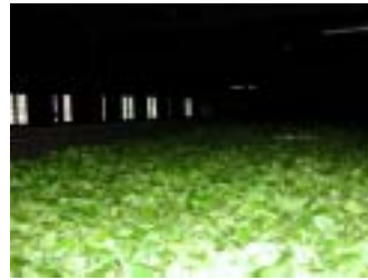
摘んだ茶葉を乾燥・萎凋（萎ませます）

スリランカの紅茶生産地は島の中央部から南部にかけて6大産地があり、エステートと呼ばれる大規模農園で行われています。セイロン紅茶は産地のある標高によってハイグロウン、ミディウムグロウン、ロウグロウンに分類されています。地域によって異なった気候条件のためにそれぞれ独特の個性をもっています。ハイグロウンは中央山岳地帯の標高1200m以上の高地で作られ、ウヴァ、ヌワラエリヤ、ディンプラ、ウダプセラワがあり、特にウヴァ（MV-11）は芳しい香りで水色も綺麗なオレンジ色、気品のある世界三大銘茶です。ミディウムグロウンは標高600m~1200m、キャンディー（MV-32）は柔らかで上品な香気を持ち渋味、タンニンが少なくしかも味にコクがあります。クリームダウンしにくいのでアイスティに最適です。もちろんストレートも美味です。ロウグロウンは標高600m以下の茶園でルフナがあります。マヴィのルフナ（MV-31）はウルワラ農園からの紅茶です。黒に近い水色でスモーキーな香りがカスタードクリーム系との相性が良いので、ミルクと砂糖をたっぷり入れて飲むのに向いています。マヴィにある3つのエリアの紅茶を飲み比べてみてはいかがでしょうか。