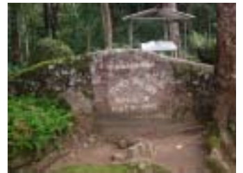
ジェームス・テイラーが住んでいたログキャビン跡

いつの時代にもその時に誰もしていなかったことを成し遂げるには才能と努力と運（タイミング）、そしてセンスが必要ですね。ですが、ジェームス・テイラーは成し遂げるために57才の生涯を独身で過ごし、紅茶の栽培と生産のことだけを考えていたそうです。後世で讃えられる人は生きていたときには偏屈といわれる人が多いですね。