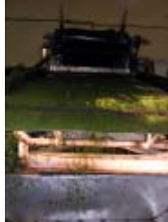
篩いにかけて葉の選別をします