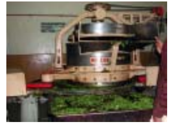
ローラーにかけ茶葉を揉捻し細かくします