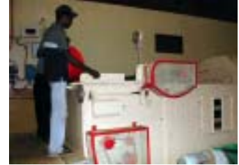
火入れをし醗酵させます